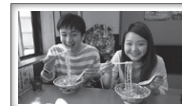
▲第1回最優秀作品「龍樹at龍上海」