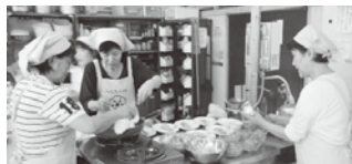
▲地区単位の料理講習会