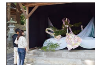
◀昨年の菊まつり 宮内会場の様子