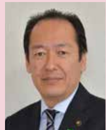
■講師 戸羽 太氏 (岩手県陸前高田市市長)