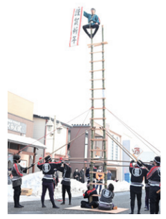
令和5年出初式の様子▲

※当日の交通規制にご協力ください。 ※表町商店会駐車場で、こんにゃく煮、豚汁の振る舞いが行われます。