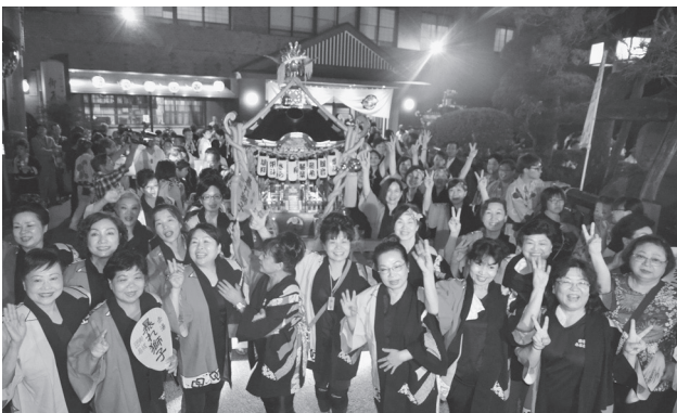
ふるさと祭りでの文化交流

台湾との民間交流を目的に、南陽市観光協会主催で行う補助事業。9月12・13日の両日、両文化団体による文化交流や合同物産展を開催するほか、「東北六県華僑総会」の総会も同時開催し、一層の理解と友好を醸成する。