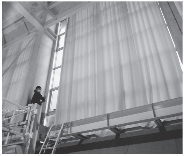
赤湯中学校体育館

梨郷小学校体育館の高窓にカーテンの新設工事と、赤湯中学校体育館の既存カーテンの開閉について利便性を図るため開閉装置の改修工事を行う。