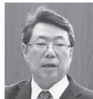
白鳥 雅巳 議員