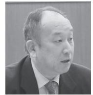
山口 裕昭 議員