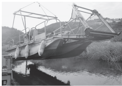
白竜湖ヒシ除去船