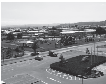
花公園（ドリームランド）

〈財政課長〉元年12月現在、4568万円。子どもたちのための基金であるため、花公園の整備に使われている。今年度の事業予定はない。