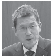
片平 志朗 議員

◎児童生徒1人1台情報端末、および高速大容量の通信ネットワークを一体的に整備し、正に個別最適化された学びを全国の学校現場で実現させるべく「GIGAスクール構想」で、総額が4千億円を