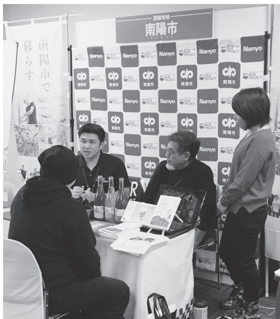
移住相談会の様子

〈みらい戦略課長〉0件だったが、今後、大阪を含めマッチングサイト登録企業を増やしていきたい。