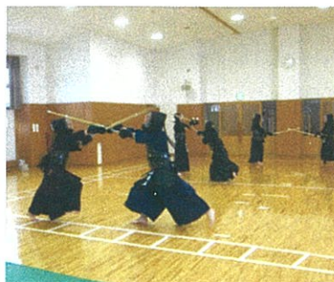
宮内中学校剣道部の部活動の様子。現在は柔道、剣道部とも、部活動は停止している。

◎部活動の地域移行が進めば中学校の武道場の利用が減っていく、今後の武道場の活用方法については。 〈教育長〉生徒数の減少で、部活動での活用は、特に宮内中学校で少なくなっている現状だ。部活動の地域移行に関わっての活用のあり方は、検討委員会を設置して議論し、より有効活用できるように検討する。 ◎武道場を地域に積極的に開放して頂きたいが、どうか。 〈管理課長〉休日等に開放した場合、学校の中で自由に入れる問題があり、難しいと捉えている。