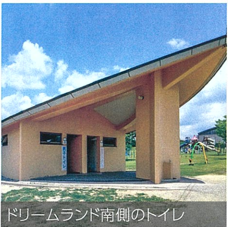
ドリームランド南側のトイレ

〈市長〉洋式化についてはできるだけ早く整備できるよう取り組みたい。バリアフリーについては構造上対応できるか検討する。