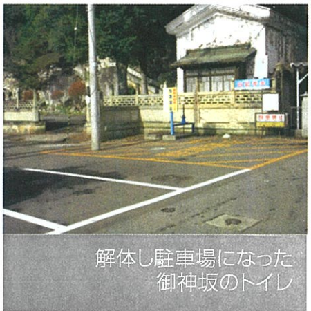
解体し駐車場になった御神坂のトイレ

〈市長〉改めて、建て替え、または解体の希望の意見をいただいた。本トイレは、現在の場所に男女別のバリアフリートイレを建築することは難しい。解体撤去し、駐車場として利用するための予算を今定例会に提案した。