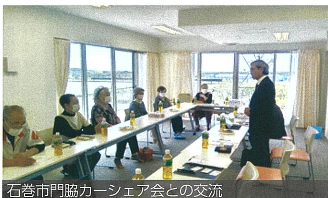
石巻市門協カーシェア会との交流