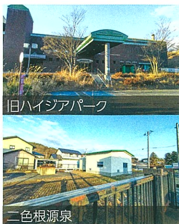
旧ハイジアパーク

その後、アスベストがカーペットの接着剤から検出され、県より8月3日には是正勧告書が出され、「四季南陽」で最終処分した。壁、天井の調査も「四季南陽」で行う。