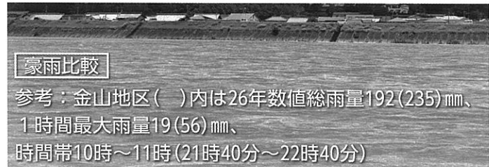
豪雨比較 参考：金山地区( )内は26年数値総雨量192(235)mm、1時間最大雨量19(56)mm、時間帯10時～11時(21時40分～22時40分)

◎この7月豪雨では雨の怖さを改めて痛感した。抜本的な対策を講じない限り安全安心な生活は得られない。河川改修は、平成26年豪雨程度までは対応できるように鋭意行われている。しかし、それを超す大雨の降ることは昨今の日本各地のゲリラ豪雨被害で容易に想像できる。遊水池などの抜本的な対策をどう考へ行動されるのか。