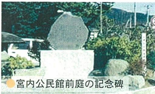
● 宮内公民館前庭の記念碑