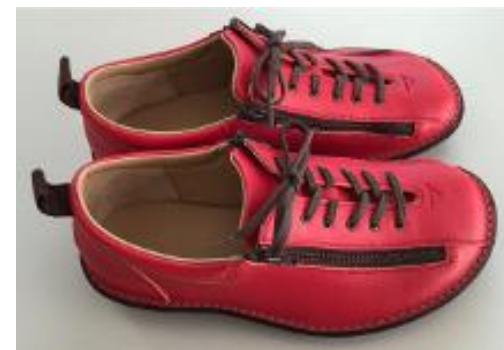
開発中の片麻痺障がい者用の靴

人口減少による国内市場の縮小が予想されることから、海外への輸出も展開しています。さらには、既存の技術を活かした、体が不自由な方のための靴の開発など、新分野の事業にもチャレンジしています。