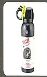
クマ撃退スプレー

④ 万一、クマに出合ったら、背を向けずに、ゆっくり後退してください。(クマ撃退スプレーの使用も有効です。)